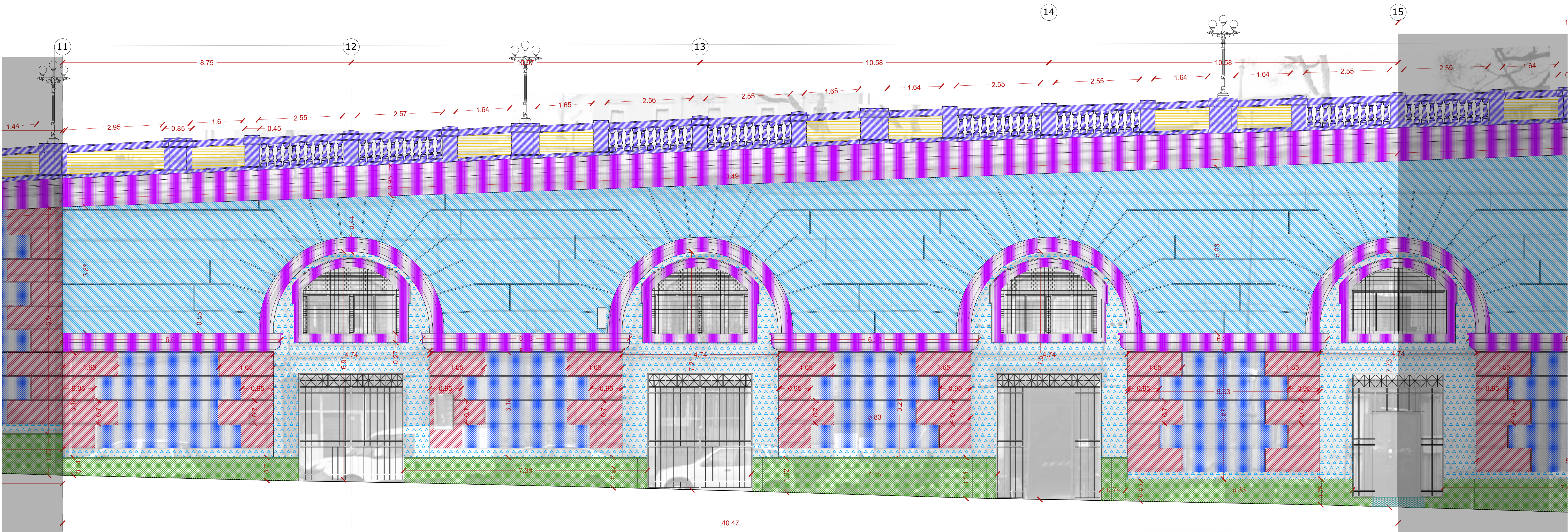
PROSPETTO ASSI 11 - 15