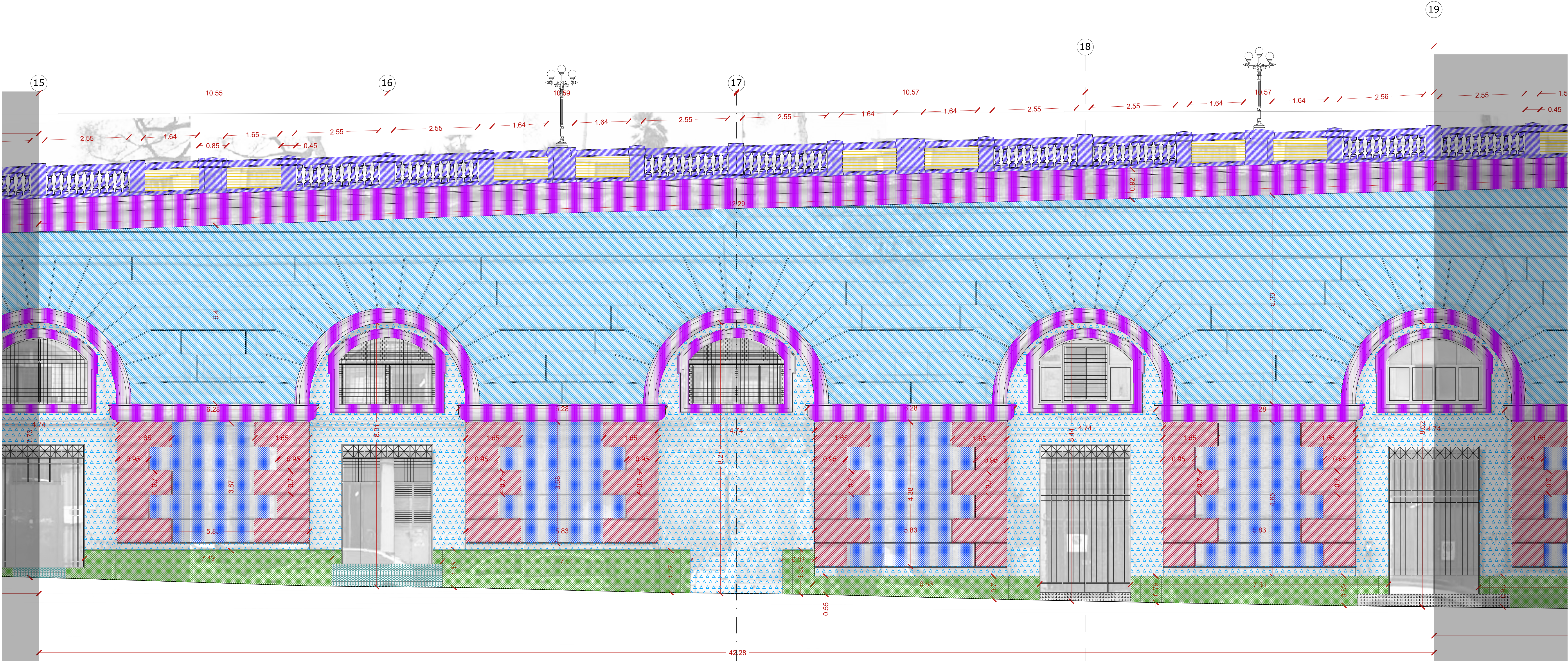
PROSPETTO ASSI 15 - 19